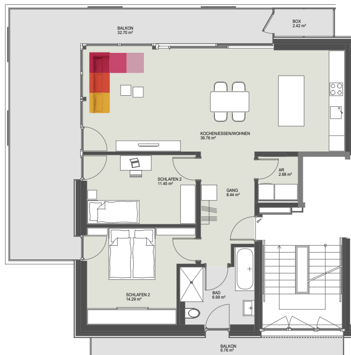
Übersicht 1. Obergeschoss