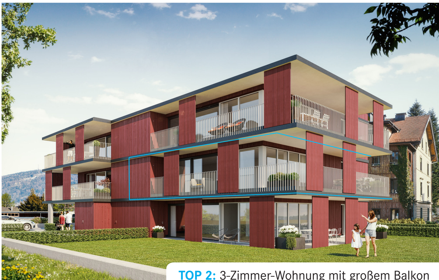
TOP 2: 3-Zimmer-Wohnung mit großem Balkon