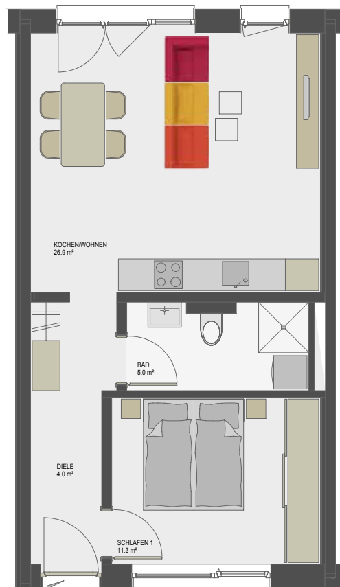
Übersicht Obergeschoss 1